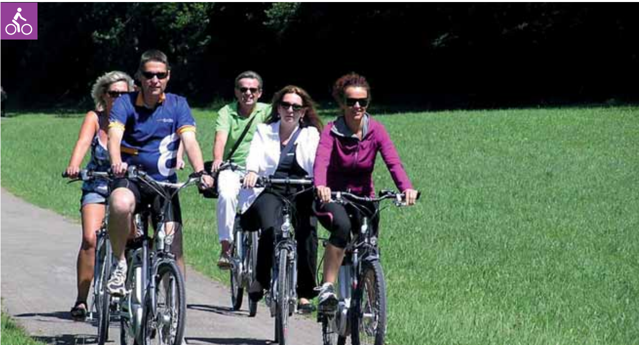
Radeln im Naturpark